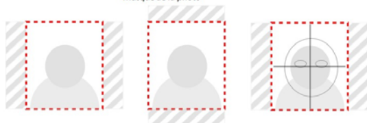
Photo valide ou pas...